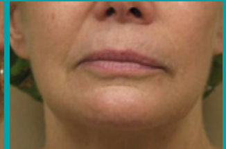
Después de 1 Tto.