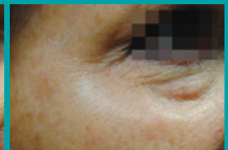
Después de 1 Tto.