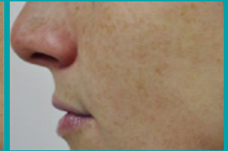
Después de 1 Tto.